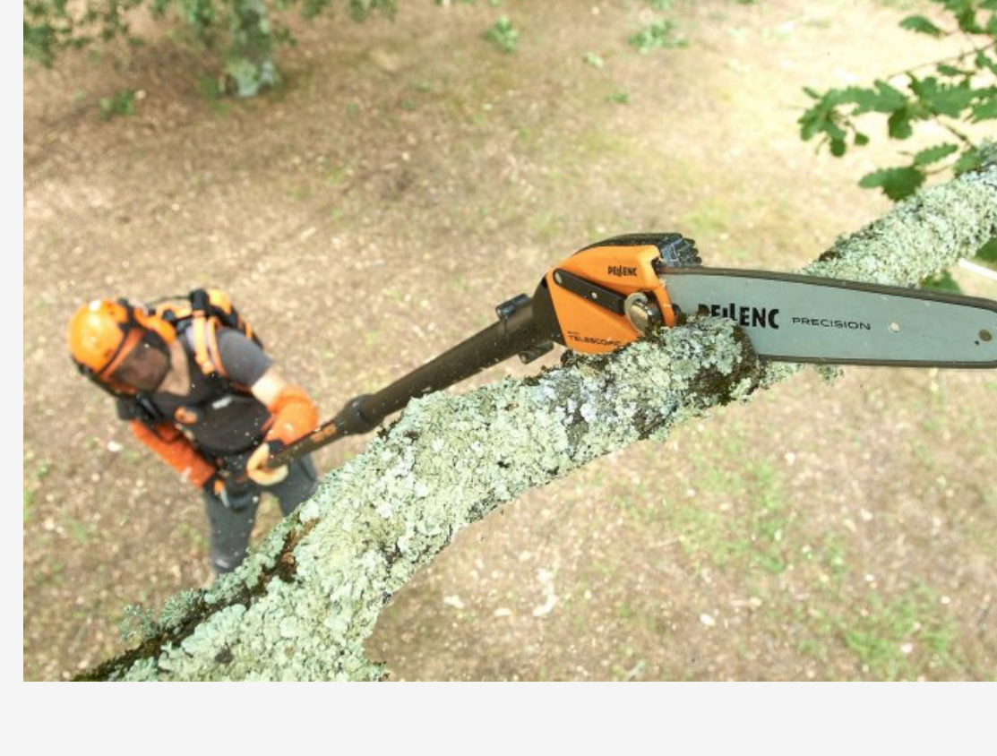
SELION TELESCOPIQ T 175/225 EVO

Elaqueuse à batterie perche SELION TELESCOPIQ T 175/225 EVO